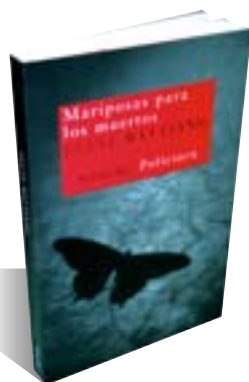
DIANE WEI LIANG Mariposas para los muertos (Siruela, 2008)

La novela de la nueva china está arrancando tantos elogios como lo está haciendo su economía. La pekinesa Diane Wei Liang , que obtuvo un gran éxito con El ojo de jade , regresa al tema policíaco con esta historia de desaparecidos y contrarios al régimen, en la que sólo una delicada mariposa de papel puede llevar a la solución del enigma. Quizás esté sobrevalorada. Yo personalmente veo un tipo de escritura similar a la de consumo (muy digna, eso sí) y en la que lo más llamativo es, precisamente, el origen de la autora.