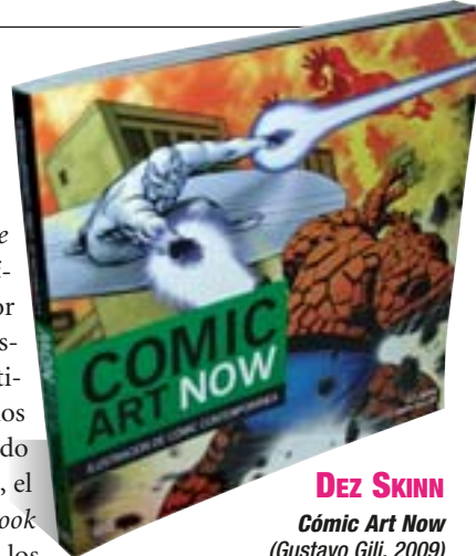
DEZ SKINN Cómic Art Now (Gustavo Gili, 2009)

éxito de los últimos años, como The Authority , Ultimate X-Men o The Ultimates . El libro está organizado por géneros y en ellos aparecen muestras de las obras más características de cada uno de ellos. Desde los héroes y villanos al terror, pasando por el humor, la ciencia-ficción, el cómic policíaco o el comic-book realista, por sus páginas desfilan los autores consagrados y los nuevos valores, y con cada muestra se indica, además del contacto del autor, la técnica utilizada y un breve análisis de la misma. / J.H.