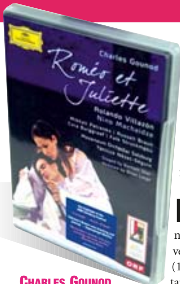
CHARLES GOUNOD Roméo et Juliette (Deutsche Grammophon, 2009)

Un nuevo texto de novela histórica con la vida de Agamenón como argumento. Sus aventuras, de las que no está claro si son reales o ficción, se narran en la Iliada de Homero. Un gran comandante que lideró campañas en la Guerra de Troya, lidó en una lucha entre dinastías y fue víctima de una gran traición.