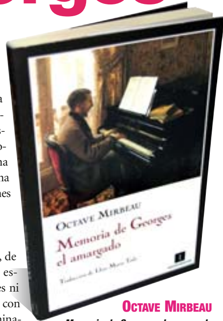
OCTAVE MIRBEAU Memoria de Georges el amargado (Impedimenta 2009)

Un mundo lleno de estupideces, de gente estúpida y de momentos estúpidos que no merecen para Georges ni el más leve esfuerzo para relacionarse con él. Motivo por el que toma la determinación de recluírse en sí mismo y así huir de la depravación social reinante. Su ausencia vital es tan grande que se topa con una aventura en la que hay un asesinato de por medio (qué maravilla la descripción que hace del descubrimiento del cadáver). Un libro, en suma, delicado, delicioso, lleno de un humor negrísimo, mordaz y políticamente incorrecto.