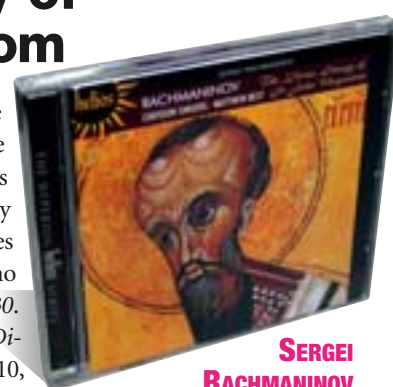
SERGEI RACHMANINOV The Divine Liturgy of St John Chrysostom (Helios, 2009)

el compositor ruso recoge el repertorio sacro de la Iglesia Ortodoxa inspirándose directamente en varios cancioneros rusos. El profundo neorromanticismo que inspiró toda la obra de Rachmaninov se vuelca de lleno en enasallar la divinidad con un puesta en escena formalmente arcaica, llena de serenidad, de espiritualidad y de misticismo. / J.H.