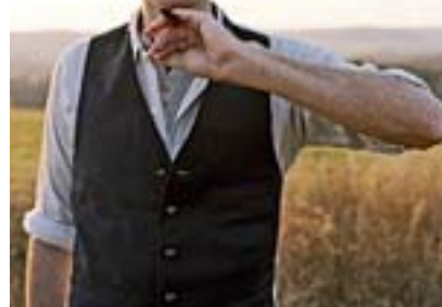
ANDREW BIRD Noble beast (Bella Union, 2009)

Se dio a conocer como violinista colaborador en la banda de jazz-swing Squirrel Nut Zippers, pero pronto comenzó a grabar sus propias canciones, una suerte de folk muy intimista con toques de blues y de jazz, lo que le ha convertido con el paso de sus nueve discos en un cantautor folk, en un baladista emocional muy reconocido por el mundo indie. Como curiosidad, decir que es un gran silbador y lo demuestra utilizando el silbido en muchas de sus canciones.