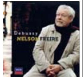
CLAUDE DEBUSSY Preludes y otras obras (Decca, 2009)

Chiwoniso Maraire es una de las cantantes más populares de Zimbabue y una voz arenosa y seductora. Tanto como el mbira , el piano de mano que pone alegría llena de emociones en su música.