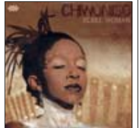
CHIWNISO Rebel woman (Cumbancha, 2008)

Dedicado a Georges Brassens , el trío de Eva Dénia repite con las canciones de este inmortal artista francés. A medio camino del jazz vocal y la chanson , el resultado es más que interesante.