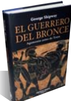
GEORGE SHIPWAY El guerrero de bronce (Pàmies, 2008)

Ya está aquí una nueva entrega de esta familia tan siniestra y divertida. Los Flood nos presentan sus orígenes en un exótico país llamado Transilvania Waters, donde brujos, gremlins, zombies y cadáveres conviven con la gente sucia, habitante del subsuelo, precisamente, ascendentes de la familia Flood. ¡Son horripilantemente divertidos!