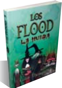
COLIN THOMPSON Los Flood. La huida (Alfaguara, 2009)

La novela de la nueva china está arrancando tantos elogios como lo está haciendo su economía. La pekinesa Diane Wei Liang , que obtuvo un gran éxito con El ojo de jade , regresa al tema policíaco con esta historia de desaparecidos y contrarios al régimen, en la que sólo una delicada mariposa de papel puede llevar a la solución del enigma. Quizás esté sobrevalorada. Yo personalmente veo un tipo de escritura similar a la de consumo (muy digna, eso sí) y en la que lo más llamativo es, precisamente, el origen de la autora.